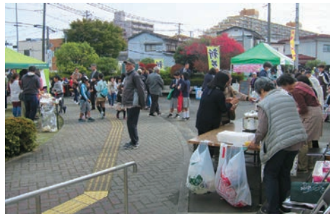
うぶすなフェスティバル 緑日の風景

つり「うぶすなフェスティバル」を開催し、地域住民の交流の場となつています。これからも新しいマンションとのコミュニティをはじめ地域の各種団体との連携を強化し、安全で住みよい地域づくりを進めていきます。