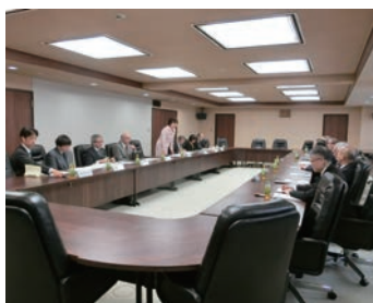
市長・副市長と正副会長会の意見交換会

町内会活性化のため加入率向上等に市と町内会が協力して取り組んでいく方策について意見交換を行いました。