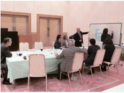
役員研修会（グループ討議）

▼役員研修会 10月16日に秋保リゾートホテルクレセントにおいて役員16名、事務局職員等11名、合計27名の参加により開催されました。 今回は、今年度の重点事項の1つである「地区連合町内会長の活動への支援のあり方について」をテーマに、課題やその原因を共有し、課題解決の方策を探ることを目的にグループ討議と全体討議を行いました。 グループ討議では、地区連合会長が抱える課題などを話し合いました。全体会では、各グループからの発表と質疑応答を通して、あて職が多いこと、女性や若者などの人材不足、活動拠点の問題などの課題と解決方策について意見交換を行いました。